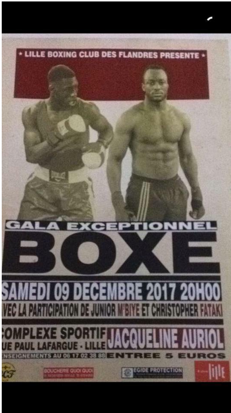
Le samedi 9 décembre 2017 à Lille au Complexe Sportif Jacqueline Auriol, rue Paul Lafargue, 59000 Lille. Gala amateur de boxe organisé par le Lille Boxing Club.

Vendredi, 01 Décembre 2017 17:07 - Mis à jour Dimanche, 24 Décembre 2017 09:20