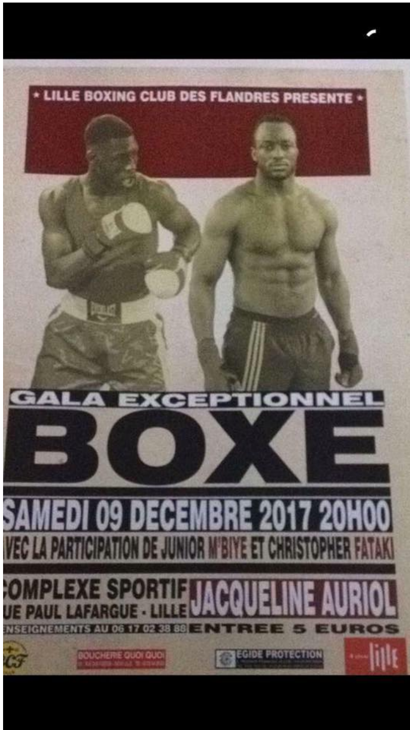
Le samedi 9 décembre 2017 à Lille au Complexe Sportif Jacqueline Auriol, rue Paul Lafargue, 59000 Lille. Gala amateur de boxe organisé par le Lille Boxing Club.

Vendredi, 01 Décembre 2017 17:07 - Mis à jour Dimanche, 24 Décembre 2017 09:20